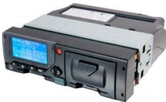
Рисунок 1 – Общий вид тахографа

Внешний вид тахографов приведен на рисунках 1-2.