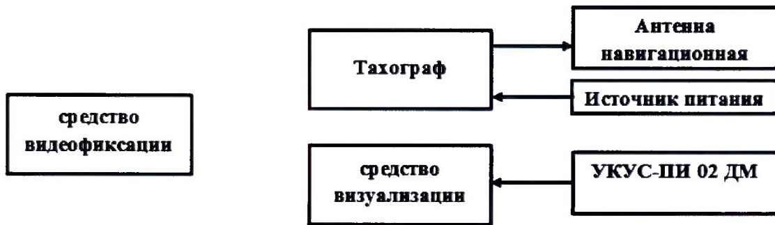
Рисунок 4 - Схема проведения измерений при определении абсолютной погрешности синхронизации шкалы времени внутреннего опорного генератора тахографа со шкалой времени блока СКЗИ

8.10.2 Обеспечить радиовидимость сигналов навигационных космических аппаратов ГЛОНАСС и GPS в верхней полусфере. В соответствии с эксплуатационной документацией на тахограф и УКУС-ПИ 02ДМ подготовить их к работе. Настроить УКУС-ПИ 02ДМ на выдачу шкалы времени, синхронизированной с национальной шкалой координированного времени UTC(SU).