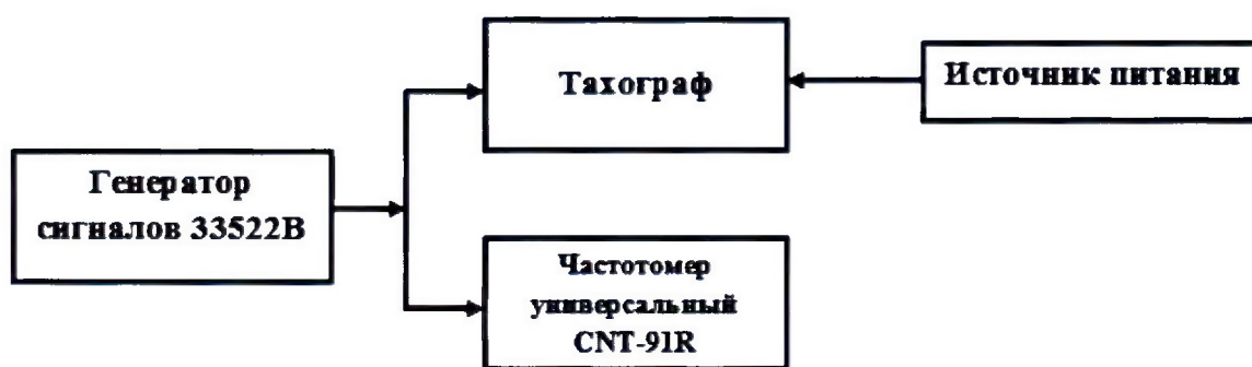
Рисунок 2 – Схема проведения измерений при определении погрешности измерения интервала времени и инструментальной погрешности пройденного пути

8.3.1 Собрать схему в соответствии с рисунком 2.